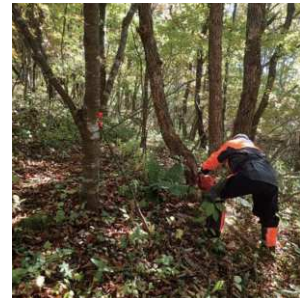
黒谷林業グループ