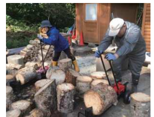
盤溪癒しの里山づくりプロジェクト委員会