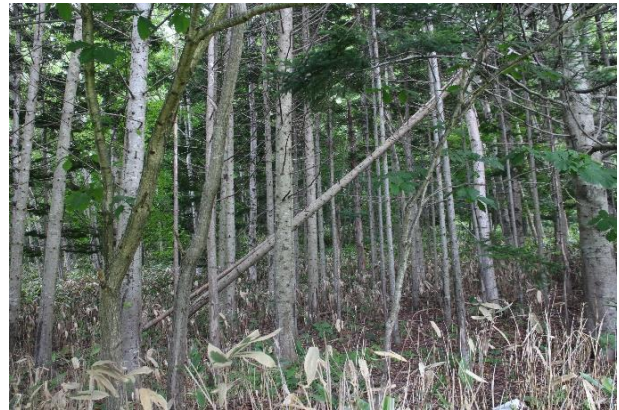
トドマツ林の林況