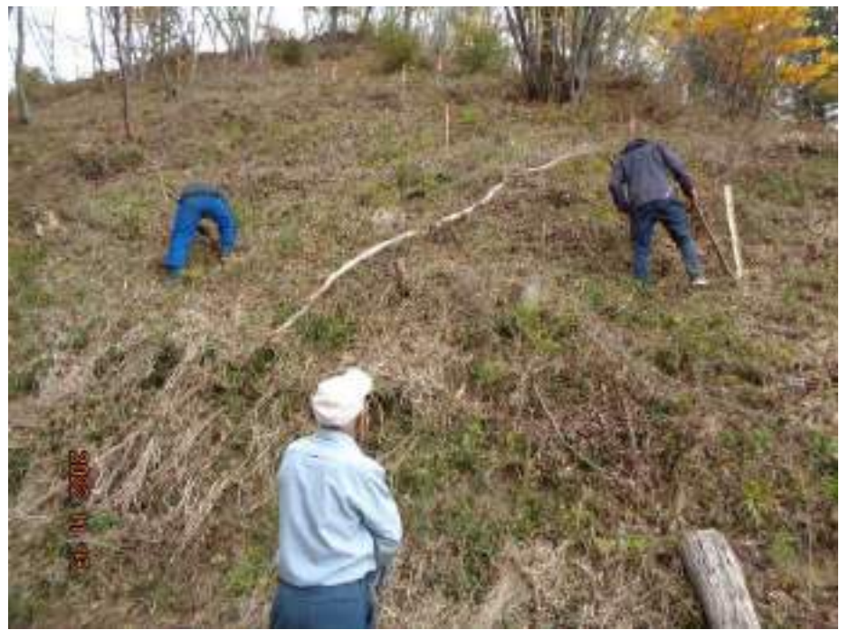
植樹 (クヌギ500本) 2022.11.13.