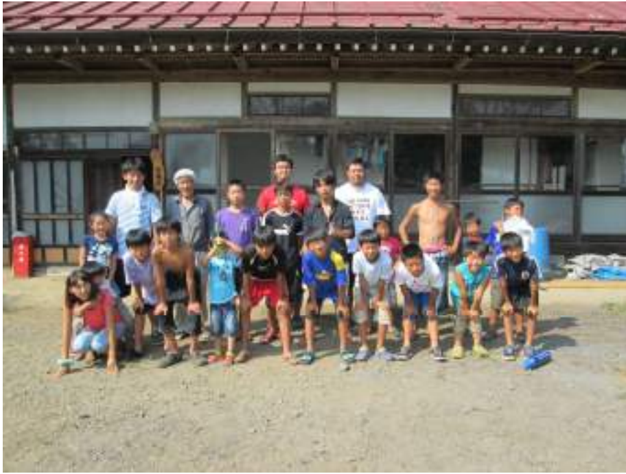
春光学園 キャンプ