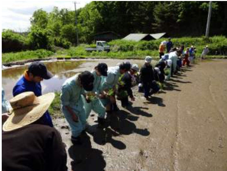
5月・田植え 会員 日大 鹿沼南高 アジア学院