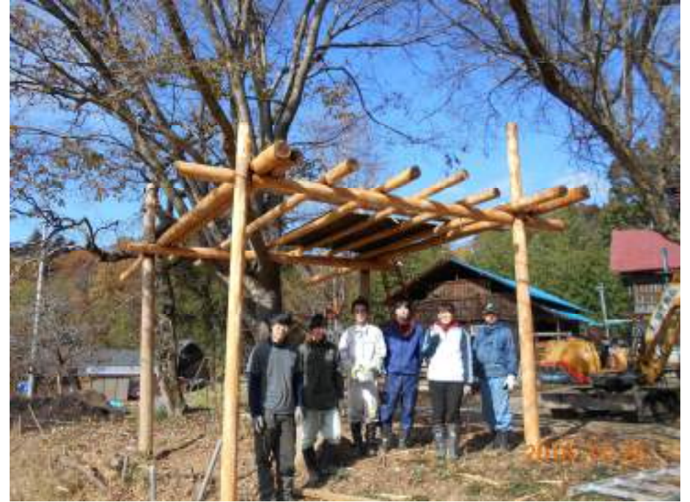
ツリーハウス by 東京農大・移住研